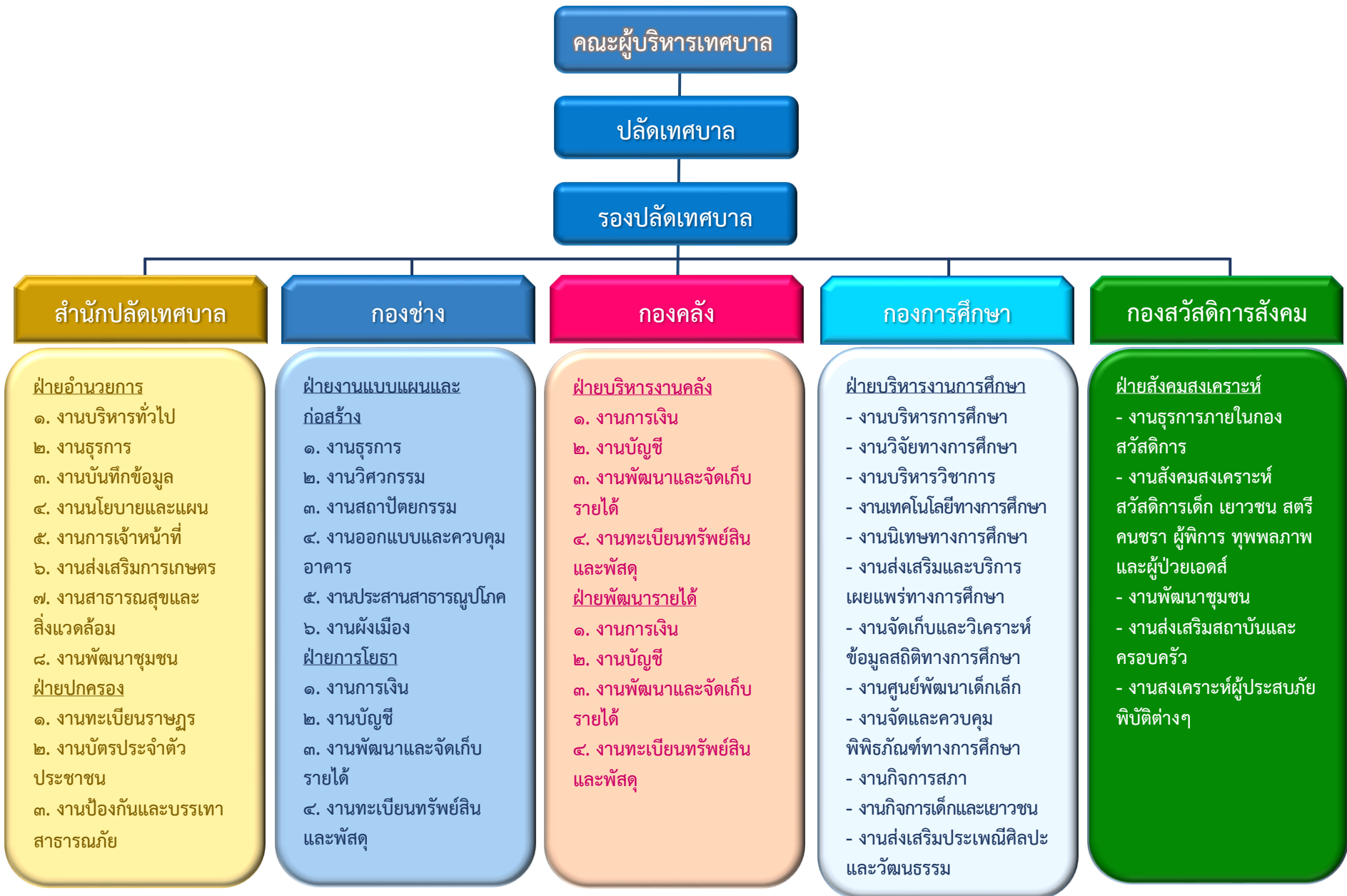
รูปที่ 1 โครงสร้างการบริหารงานเทศบาลตำบลผาสุก