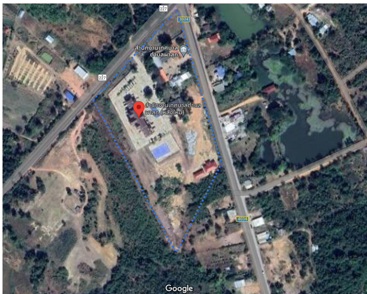
รูปที่ 2 แผนผังขอบเขตขององค์กร

พื้นที่ทั้งหมดของเทศบาลตำบลมีขนาด 212 ตารางกิโลเมตร หรือ 132,500 ไร่ โดยแบ่งเป็นขนาดพื้นที่ตั้งภายใต้อำนาจการควบคุมการดำเนินงานของเทศบาลทั้งหมดประมาณ 12 ไร่ หรือคิดเป็น 19,280 ตารางเมตร ขอบเขตการวิเคราะห์คาร์บอนฟุตพริ้นท์ขององค์กรประกอบไปด้วย สำนักปลัดเทศบาล กองช่าง กองคลัง กองการศึกษา กองสวัสดิการสังคม ซึ่งจะครอบคลุมการดำเนินงาน ดังนี้ 1) อาคารสำนักงาน 2) อาคารสำนักงานหลังเก่า 3) ศูนย์พัฒนาเด็กเล็กเทศบาลตำบลผาสุก แสดงได้ดังรูปที่ 2